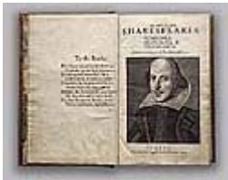
Figura 9 Immagine dell'opera

Caratteristiche dell’edizione: Commento di Arthur Freeman; monografia relativa alla stampa realizzata da First Folio; Prezzo: 80 € La Research Edition contiene 462 immagini digitali in formato JPEG su 20 CD-ROM, un’ esaltazione dell’ 500% del lavoro originale e una copia omaggio della “Octavo Edition”; Prezzo: 1255 €