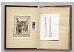
Figura 5 Immagine dell'opera

Caratteristiche dell'edizione: Commento di Nicolas Barker; Prezzo: 20 $