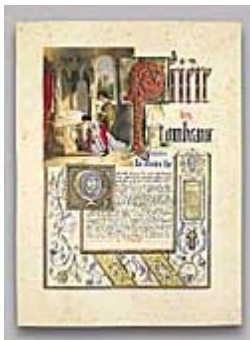
Figura 3 Immagine dell'opera

Caratteristiche della Research Edition : contiene 29 immagini digitali in formato JPEG su 1 CD-ROM, un' esaltazione del 500% del lavoro originale; Prezzo: 255 €