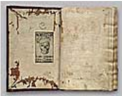
Figura 7 Immagine dell'opera

Caratteristiche della Research Edition : contiene 88 immagini digitali in formato JPEG su 2 CD-ROM, un' esaltazione del 700% del lavoro originale; Prezzo: 255 €