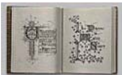
Figura 11 Immagine dell'opera