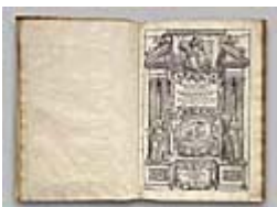
Figura 2 Immagine dell'opera