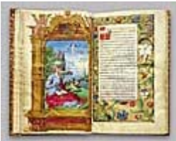
Figura 10 Immagine dell'opera

Caratteristiche dell'edizione: Commento di Christopher de Hamel; saggio supplementare sull'arte di realizzare manoscritti; un live- text latino- inglese; Prezzo : 35 €