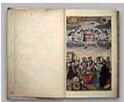
Figura 4 Immagine dell’opera

Caratteristiche della Research Edition: contiene 243 immagini digitali in formato JPEG su 5 CD-ROM, un’ esaltazione del 500% del lavoro originale; Prezzo: 455 €