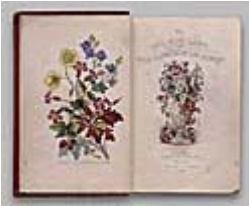
Figura 6 Immagine dell'opera

Caratteristiche della Research Edition : contiene 208 immagini digitali in formato JPEG su 5 CD-ROM, un' esaltazione del 1200% del lavoro originale; Prezzo: 255 €