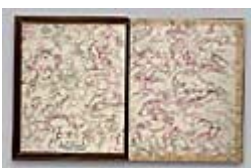
Figura 8 Immagine dell'opera

Caratteristiche dell'edizione: Commento di Nicolas Barker; saggio dettagliato che rivela la provenienza di quest'opera Prezzo: 25 €